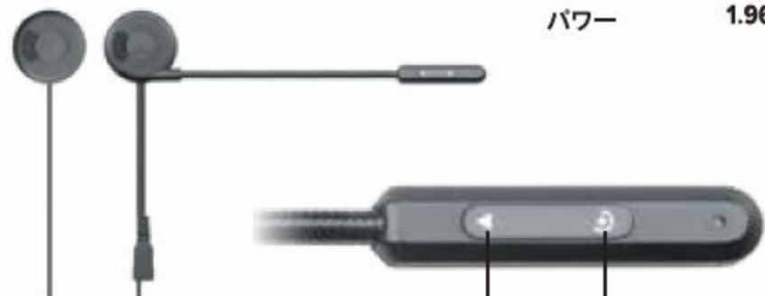
電源ボタン ポリュームボタン